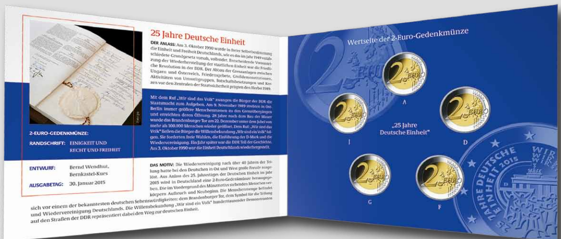
Innenseiten mit interessanten Informationen zur 2-Euro-Gedenkmünze und zum Anlass.