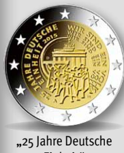
„25 Jahre Deutsche Einheit“

Die Münzen in Spiegel- und Stempelglanzprägung sind sicher geschützt in eine speziell angefertigte Plastikummantelung eingelegt, die fest mit dem Hintergrund verklebt ist.