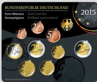
Technische Parameter der Münzen (bei Spiegelglanz auf der Rückseite des Schubers).