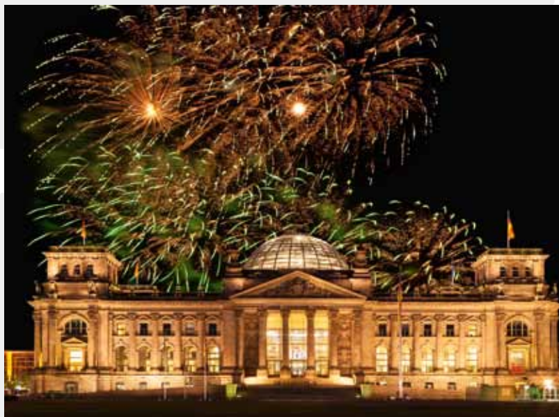
In der Stadt des Bürgerfestes wird am 3. Oktober stets ein großes Feuerwerk veranstaltet – hier am Berliner Reichstag.

2014 beschäftigten sich bereits zahlreiche Veranstaltungen mit dem Thema „ 25 Jahre Mauerfall “. Auch das Jubiläumsjahr 2015 wird mit vielen Feierlichkeiten begangen. Das traditionelle Bürgerfest , bei dem sich auf der sogenannten Ländermeile die Länder und die Regierung jedes Jahr in einer anderen deutschen Stadt vorstellen, wird in Frankfurt am Main stattfinden. Zwischen dem 2. und 4. Oktober 2015 werden dazu etwa eine Million Besucher in der Stadt erwartet.