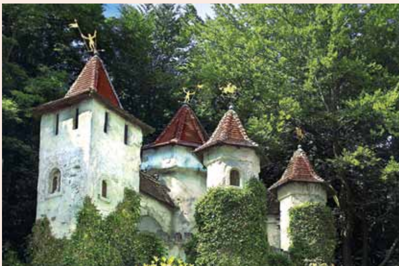
Das Dornröschenschloss ist in fast jedem Märchenwald weltweit zu finden – hier besonders idyllisch im niederländischen Vergnügungspark Efteling.