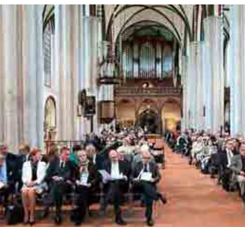
Die Nikolaikirche, die einen bedeutenden Münzschatz beherbergt, bot einen festlichen Rahmen für die offizielle Präsentation.

Die Nikolaikirche ist das älteste erhaltene Bauwerk Berlins mit großer Bedeutung für die Geschichte der Stadt – und übrigens auch für Münzfans. Nach ihrer Zerstörung im Zweiten Weltkrieg wurde sie erst ab 1984 wieder aufgebaut und 1987 als Museum eröffnet. Seit 2010 befindet sich hier die Dauerausstellung „Vom Stadtgrund bis zur Doppelspitze“ des Berliner Stadtmuseums. Hier ist unter anderem der einzigartige Münzschatz zu besichtigen, den Berliner Bürger zwischen 1514 und 1734 für den Turmkauf der Nikolaikirche zusammengetragen hatten. Noch bis 1990 galt er als verschollen.