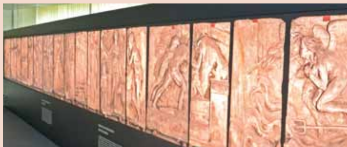
Eine einzigartige Gelegenheit, das Münzfries aus nächster Nähe zu betrachten

Noch bis zum 31. Oktober 2014 ist in der Staatlichen Münze Berlin eine Fotoinstallation großformatiger Aufnahmen des 38 Meter langen Münzfrieses , das der Bildhauer Johann Gottfried Schadow zum Schmuck der Außenwände der 1800 erbauten Berliner Münze schuf, zu sehen. Die Ausstellung in der Ollenhauerstraße 97 in Reinickendorf ist Montags bis Freitags von 10.00 bis 17.00 Uhr zu besichtigen. Sie wurde am 8. Mai anlässlich des 250. Geburtstags von Schadow eröffnet. Der Eintritt ist frei. Weitere Informationen unter www.muenze-berlin.de .