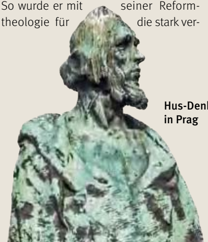
Hus-Denkmal in Prag

Hus predigte in der Sprache des Volkes und griff die damalige Papstkirche an. Er verlangte von den Geistlichen, dem Volk zu dienen und verstand damit die Volksseele anzusprechen. So wurde er mit seiner Reformtheologie für die stark ver-