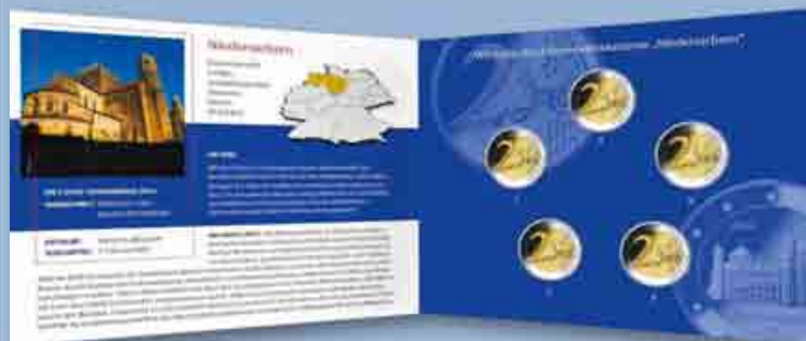
Innenseiten mit interessanten Informationen zur 2-Euro-Gedenkmünze und zum Motiv.

* Die gegenüber den deutschen Münzstätten beauftragten Stückzahlen werden nach Abschluss des Prägejahres veröffentlicht.