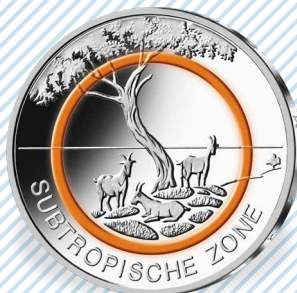
„Subtropische Zone“ (2018)