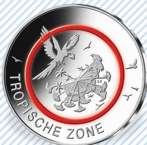
„Tropische Zone“ (2017)