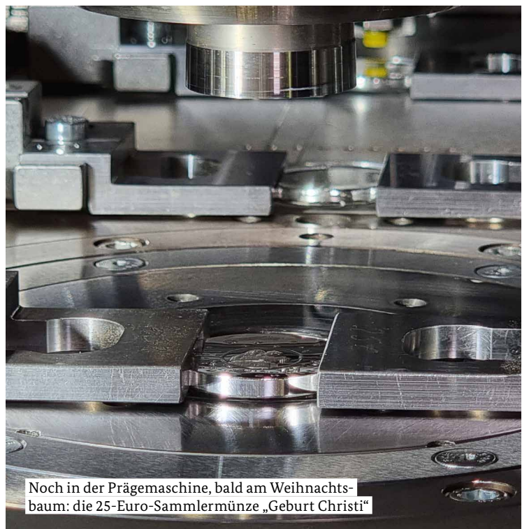
Noch in der Prägemaschine, bald am Weihnachtsbaum: die 25-Euro-Sammlermünze „Geburt Christi“

Die Verpackungskapsel ist speziell mit einer Öse versehen. Die Münze lässt sich dadurch als Dekoration am Weihnachtsbaum aufhängen.