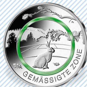
„Gemäßigte Zone“ (2019)