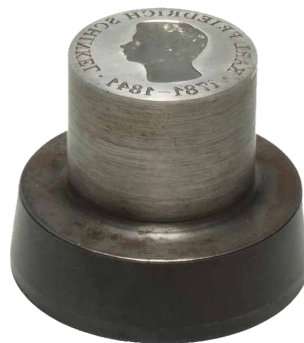
Eine der ersten DDR-Gedenkmünzen in Tellerprägung: 10-Mark-Münze „Karl Friedrich Schinkel“ (1966) und der dazugehörige Prägestempel

Die Technik der Tellerprägung wurde ab 1966 in der DDR eingesetzt. Diese Münzform war zu jener Zeit international äu-