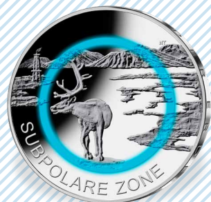
„Subpolare Zone“ (2020)