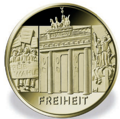
Diese drei Münzen umfasst die neue 100-Euro-Goldserie „Säulen der Demokratie“.