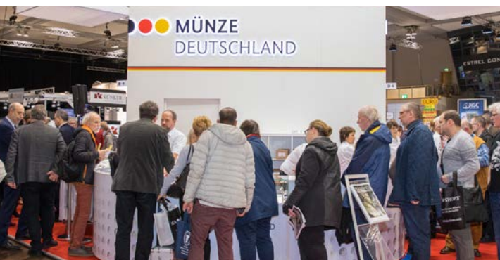
Besucher am Messestand