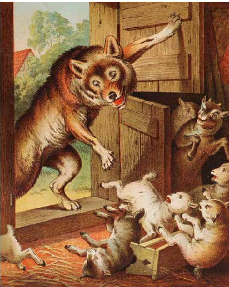
Illustration aus ‚Mein erstes Märchenbuch. Eine Sammlung echter Kindermärchen für die ganz Kleinen‘ (C. Offterdinger und H. Leutemann).

Das Erzählen von wundersamen Geschichten ist eine uralte Tradition. Die Gebrüder Grimm hielten eine Vielzahl von ihnen für die Ewigkeit auf Papier fest. Die Märchenmünze für das Jahr 2020 ziert eine Szene aus „Der Wolf und die sieben Geißlein“.