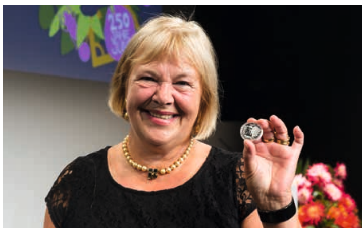
Die Parlamentarische Staatssekretärin Frau Bettina Hagedorn präsentiert die Humboldt-Münze.