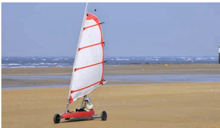
Auf ausgedehnten Sandstränden häufiger zu sehen: Ein Strandsegler.

Als Abschluss des Münzprogramms 2020 erscheint am 8. Oktober das 2-Euro-Sonderset „50 Jahre Kniefall von Warschau“. Am 7. Dezember 1970 besuchte der damalige Bundeskanzler Willy Brandt das Denkmal zum Aufstand im Warschauer Ghetto 1943 zur Kranzlegung und kniete – zur Überraschung aller Anwesenden – vor diesem nieder. Der Kniefall Brandts gilt heute als bedeutende Demutsgeste angesichts der NS-Verbrechen im Zweiten Weltkrieg. Die Münzausgabe am 8. Oktober 2020 würdigt dieses historische Ereignis und nebenbei auch den Bundeskanzler und Friedensnobelpreisträger selbst: Willy Brandt starb an diesem Tag vor 28 Jahren.