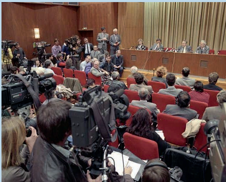
Sekretär des ZK der SED Günther Schabowski stellte sich am 9. November 1989 im Internationalen Pressezentrum den Fragen der Journalisten.

Günther Schabowski: Also, doch, doch (liest vor): „Die ständige Ausreise kann über alle Grenzübergangsstellen der DDR zur BRD bzw. zu Berlin-West erfolgen.“