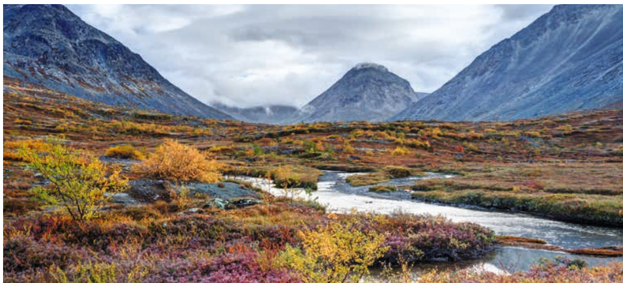
Tundralandschaften und karge Berge sind typisch für Gebiete in der subpolaren Klimazone.

ders sein – in einen Fußball umgemünzt; zu sehen sind außerdem die Namen aller zwölf Austragungsstätten. Der Entwurf stammt vom Künstler Thomas Serres aus Hattingen.