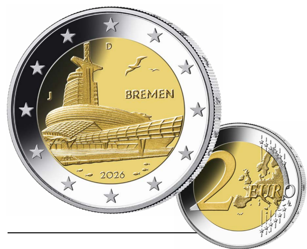
2-Euro-Gedenkmünze »Bremen« (viertes Motiv der Serie »Bundesländer II«)

Nach Hamburg, Mecklenburg-Vorpommern und dem Saarland ist Bremen die vierte Station der numismatischen Reise zu den Sehenswürdigkeiten und regionalen Besonderheiten der 16 Bundesländer. Die 2-Euro-Gedenkmünze »Bremen« aus der Serie »Bundesländer II« zeigt das Klimahaus Bremerhaven.