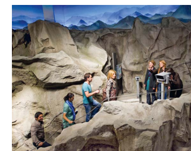
Ganz unterschiedliche Welten an einem Ort: Das Klimahaus Bremerhaven lädt zu Entdeckungsreisen ein.

Interaktive Exponate, medial inszenierte Räume, detailreiche Kulissen sowie lebende Tiere und Pflanzen machen das Thema Klima auf nachvollziehbare und emotionale Weise erfahrbar. Das Klimahaus zeigt nicht nur die Folgen des Klimawandels, sondern macht auch deutlich, welche Handlungsmöglichkeiten jeder Einzelne besitzt, um aktiv zum Klimaschutz beizutragen.