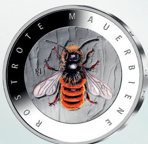
Rostrote Mauerbiene (2023)

Künstler: Claudius Riedmiller, Stuttgart