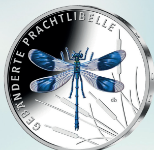
Gebänderte Prachtlibelle (2023)

Künstler: Claudius Riedmiller, Stuttgart