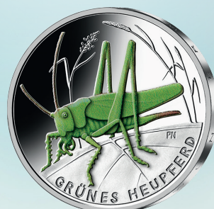
Grünes Heupferd (2024)

Künstler: Patrick Niesel, Röthenbach a. d. Pegnitz