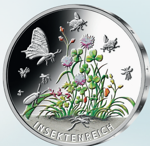
Wunderwelt Insekten (2022)

Künstler: Jordi Truxa, Neuenhagen bei Berlin